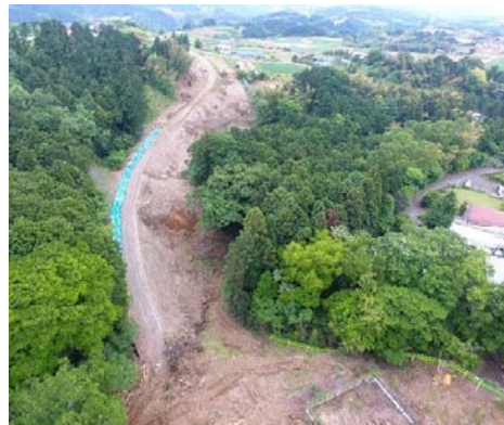
施工箇所 伐採作業中

現場周辺の方々にはご迷惑をお掛けしますが、一般車両優先、安全運転を心掛けますので、ご理解とご協力をお願いします。また、気になる点がございましたら、何なりと当方にお申し付け下さい。