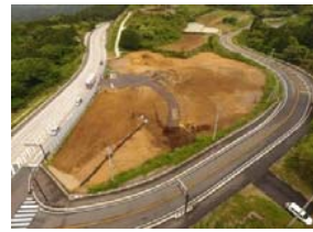
【山中工区】 残土受入、整地