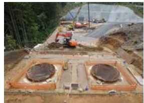
【エビノ木工区】 2号橋A2橋台 深礎杭