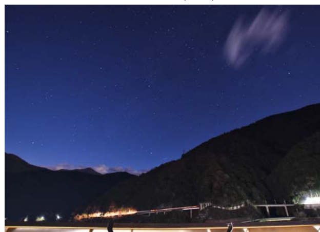
ダムの上から見る満天の星