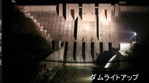
ダムライトアップ