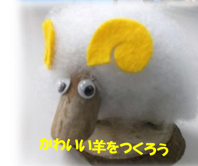
かわいい羊をつくろう

【開催日時】 平成27年8月1日(土) 13:00~15:30 【開催場所】 長島ダム防災施設ふれあい館 【定員】 先着30名(当日受付のみ) 【問合せ先】 長島ダム管理所 TEL:0547-59-1021 (平日9時00分~17時00分) 静岡県榛原郡川根本町犬間541-3