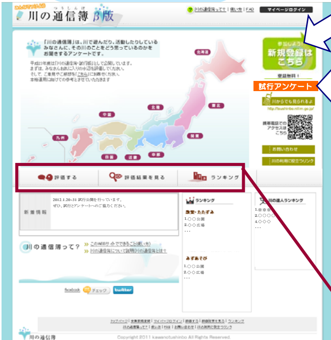
Web版「川の通信簿」TOPページ