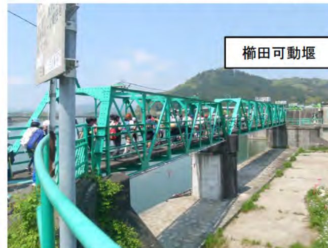
管理橋を渡り、左岸へ