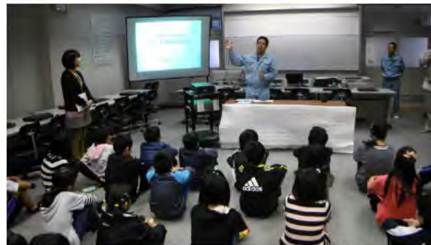
嶋橋監理技術者による土木工事説明