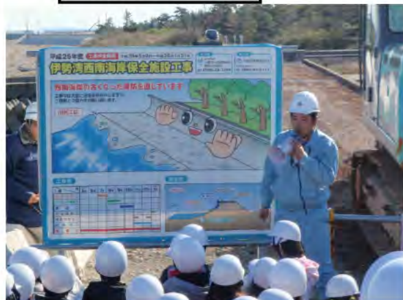
現場で工事を説明