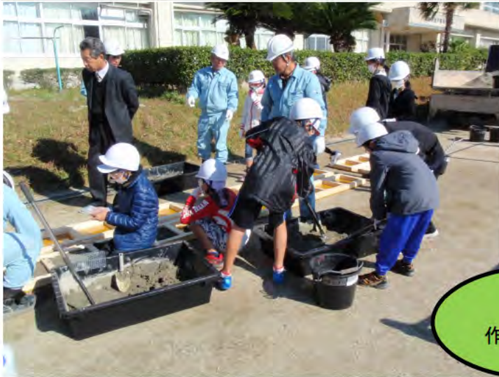
コンクリートを練り混ぜて