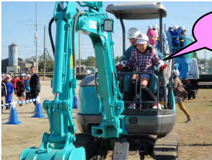
② ショベルカーに試乗しました