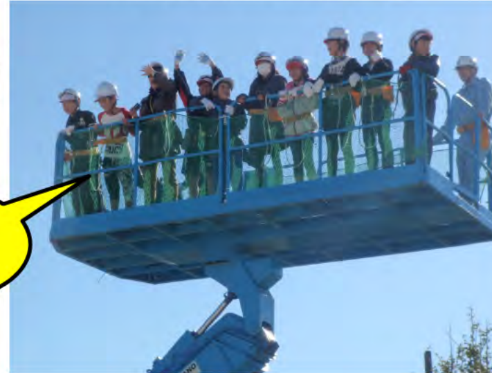
③ 高所作業車にも乗りました