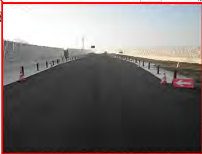
平成25年度 23号久居南舗装工事(受注者:福田道路(株)) 現場