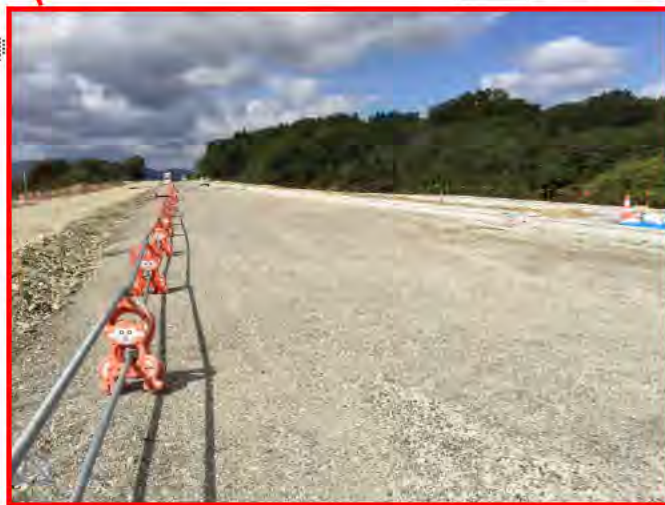
平成26年度 23号久居相川舗装工事 現場