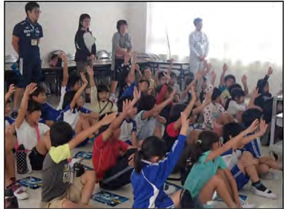
将来の技術者の卵? 皆さん、興味を持って熱心に聞いて頂けました。