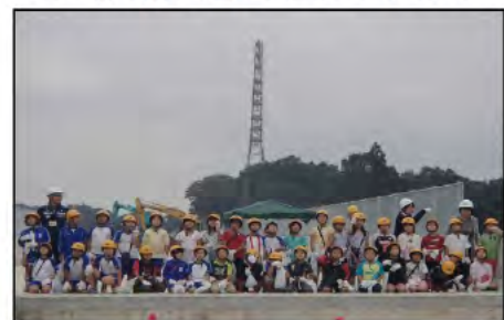
お疲れ様でした。ありがとうございました。