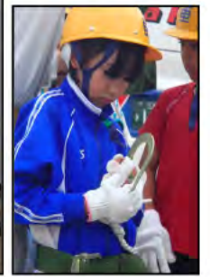
安全ベルト装着、安全管理も重要です。