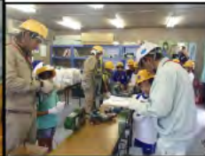
女性の技術者も増加してほしいです。