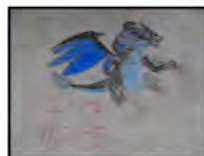
橋上での芸術体験。 普段出来ない体験に皆一生懸命でした。