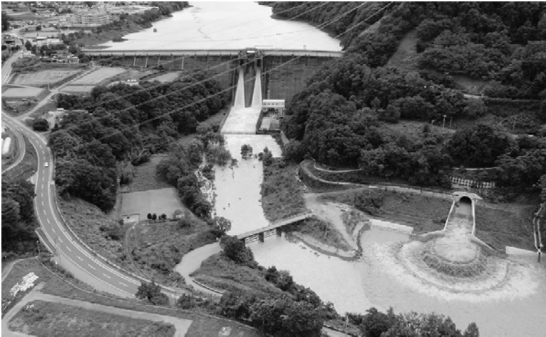
平成19年9月洪水時の試験運用の状況

美和ダムでは、全国の直轄ダムでは初めて、ダム湖への堆砂を抑制する恒久堆砂対策に取り組んでいます。その中心となる施設が土砂バイパス施設です。平成13年1月から工事に着手し、平成17年5月に完成しました。その後、平成18年7月より土砂バイパス施設の試験運用を開始し、平成23年には5月・9月の洪水時に試験運用を行っています。