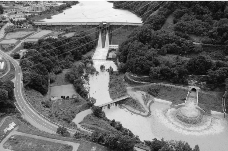
平成19年9月洪水時の試験運用の状況

美和ダムでは、全国の直轄ダムでは初めて、ダム湖への堆砂を抑制する恒久堆砂対策に取り組んでいます。その中心となる施設が洪水バイパス施設です。平成13年1月から工事に着手し、平成17年5月に完成しました。その後、平成18年7月、平成19年7月、9月の洪水時に試験運用を行ってきています。