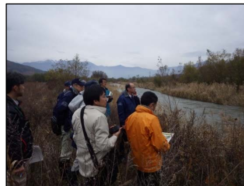
三峰川下流河川視察状況(⑤)