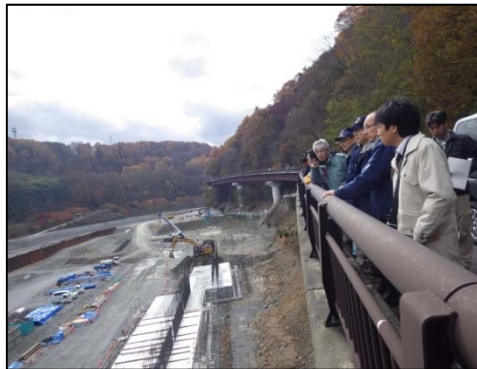
ストックヤード工事現場視察状況(②)