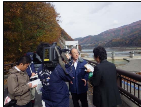
取材を受ける角委員長(②)