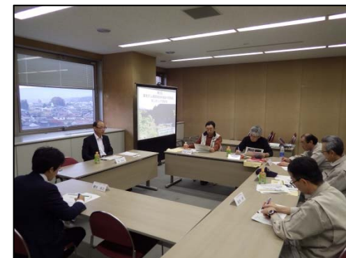
現地視察後の打合せ状況(⑥)