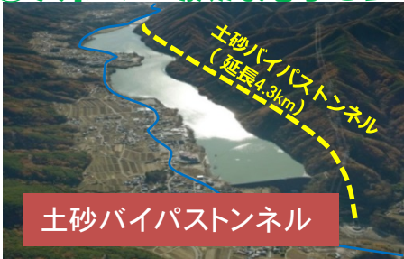
土砂バイパストンネル