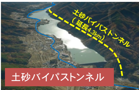
土砂バイパストンネル