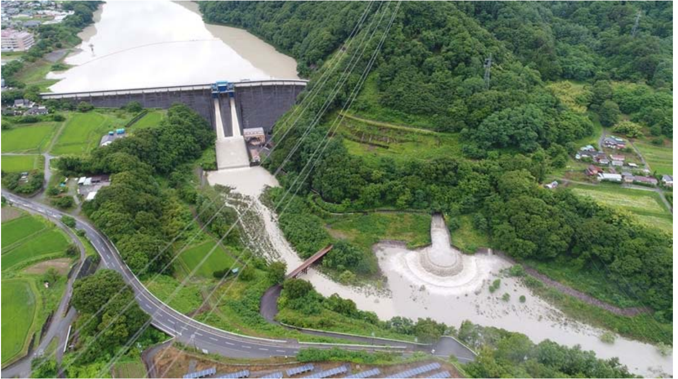
放流中の状況 平成30年7月7日 5時8分 バイパス放流量 毎秒約110m 3