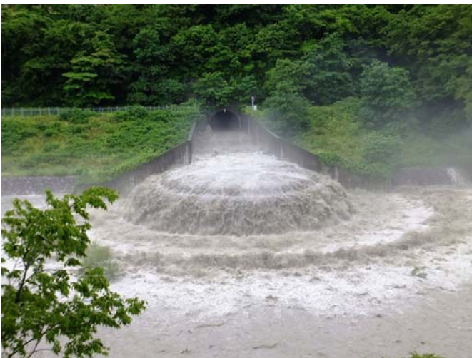
放流中の状況 (拡大)