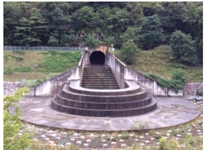
放流していない状況