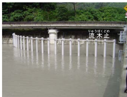
②三峰川バイパス流入部 (流入部の状況 15日 11:50)