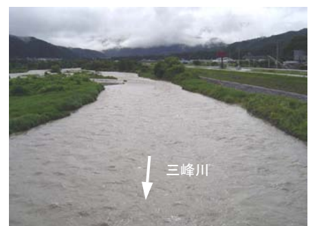
⑥三峰川橋上流の流況 (放流中の状況 15日 8:20)