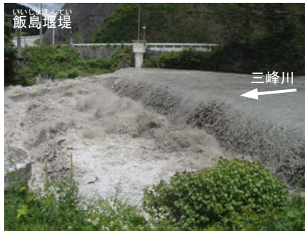
①飯島堰堤 (流入部の状況 15日 12:00)