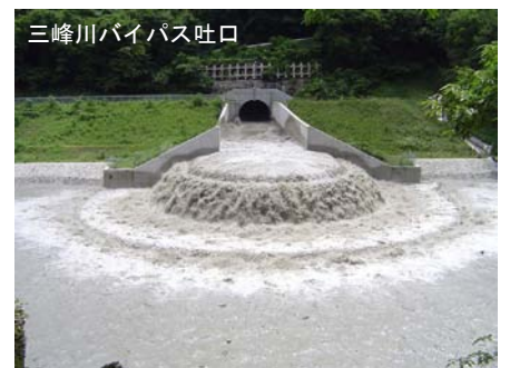
③三峰川バイパス放流水 (放流中の状況 15日 13:10)