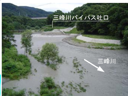
④三峰川バイパス下流河道 (放流中の状況 15日 13:50)