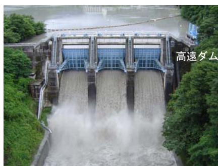
⑤高遠ダムゲート放流 (放流中の状況 15日 13:40)