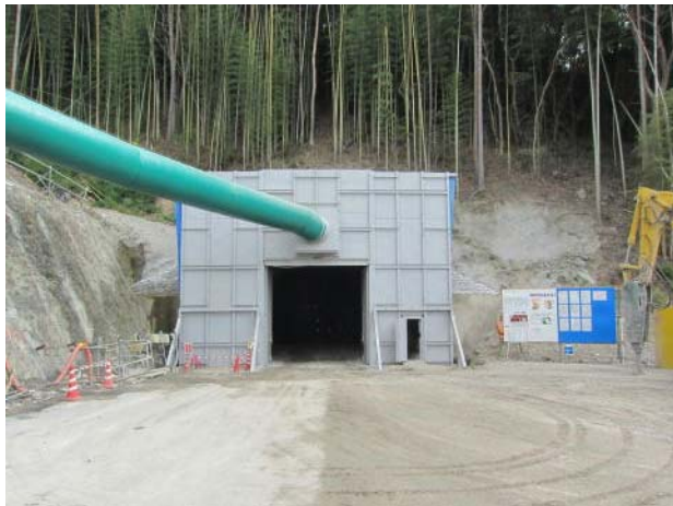
トンネル起点側坑口付近

L = 170 m (平成23年10月末時点の予定) 平成24年1月頃の貫通を目指して施工中です。