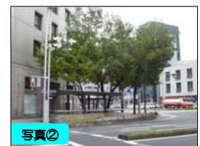
車道への張り出し、信号との近接