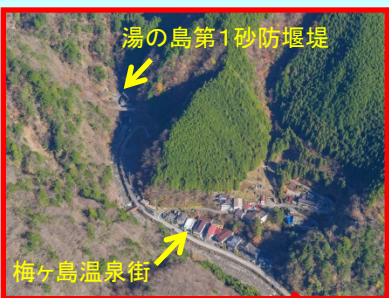
昭和41年9月 土石流により被災した梅ヶ島温泉街