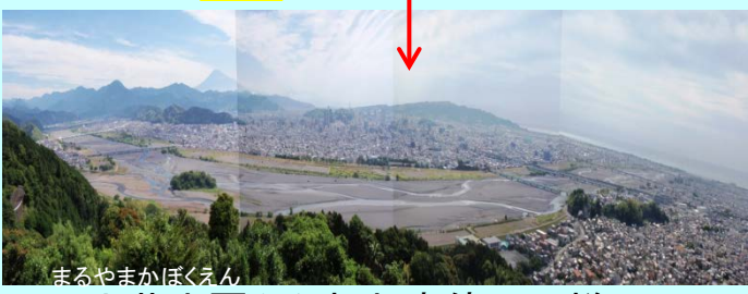
円山花木園から望む安倍川の様子