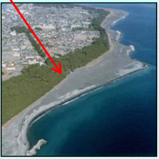
③ 侵食が進む清水 (三保)海岸

【問合せ先】 静岡河川事務所 総務課 電話：054-273-9100 【アクセス】 東名高速道路 静岡ICより車で約30分（約6km）