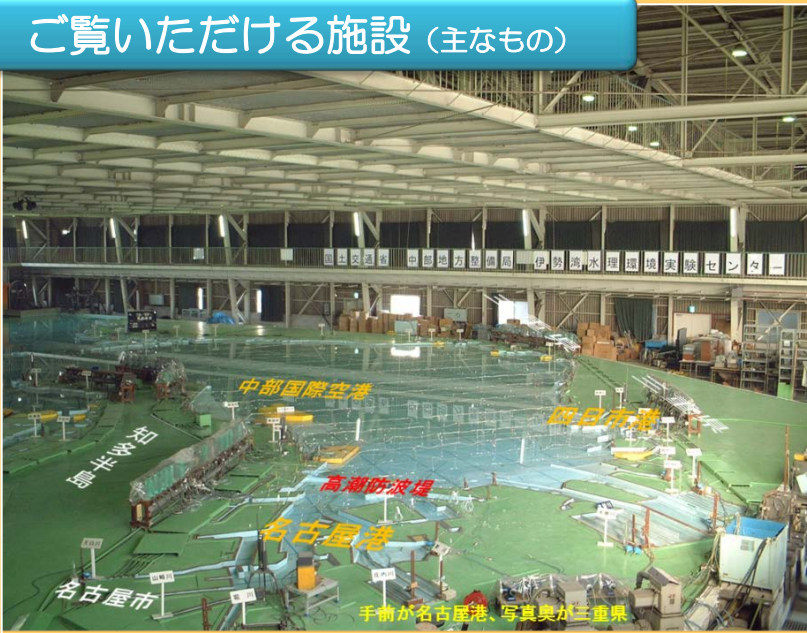
巨大な伊勢湾模型