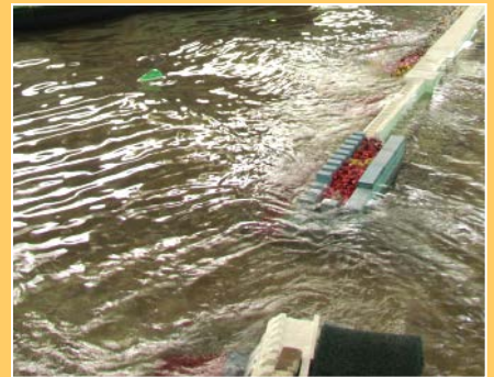
平面水槽 防波堤安定実験