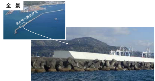
緊急対策のイメージ(防波堤の補強)

しみず がいこう 清水港外港地区防波堤(改良)整備事業 おまえざき めいわ 御前崎港女岩地区防波堤(改良)整備事業 なごや とびしま 名古屋港飛島ふ頭地区ふ頭再編改良事業 みかわ じんの 三河港神野地区岸壁改良事業