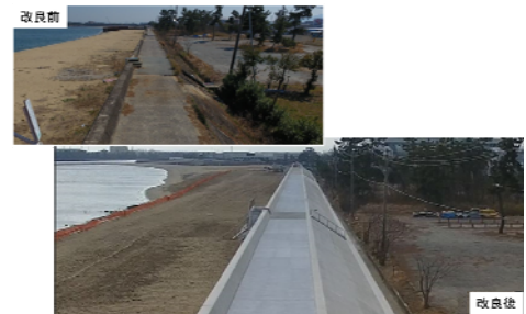
緊急対策のイメージ(堤防改良)