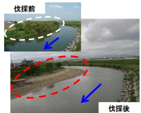
緊急対策のイメージ(樹木伐採)

木曾川上流河川改修事業 岐阜市 ひがしじま 東島地区 富士山直轄砂防事業 富士宮市 おおさわ 大沢川遊砂地 庄内川河川改修事業 名古屋市 うちで 打出地区 木曾川下流河川改修事業 桑名市 がまがんじ 鎌ヶ地地区 天竜川水系直轄砂防事業 駒ヶ根市 なかたぎり 中田切川砂防堰堤改築 富士山直轄砂防事業 南都留郡 みなみつるぐん 富士河口湖町 ふじかわぐちこまち 富士山北麓緊急減災対策工 ほくろく