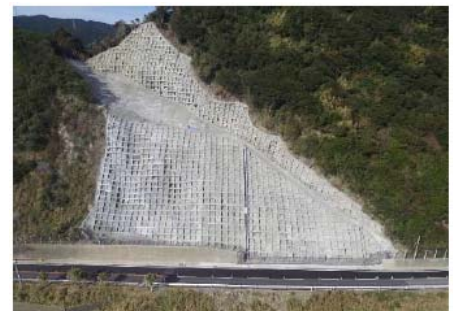
緊急対策のイメージ(法面对策)

静岡 1号 維持管理(緊急対策) 長野 19号 維持管理(緊急対策) 愛知 23号 維持管理(緊急対策) 岐阜 41号 維持管理(緊急対策) 三重 42号 維持管理(緊急対策) 国道 1号 ささはらやまなか 笹原山中バイパス H31 開通予定 国道156号 やまと 大和改良 H32 開通予定