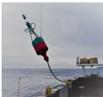
<浮標灯（緑色）の撤去状況>