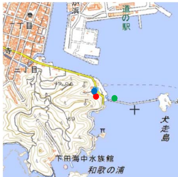
凡例：●集合場所、●乗船場所、●下田海上保安部

国土地理院地図(電子国土 Web) ( http://maps.gsi.go.jp )をもとに国土交通省作成