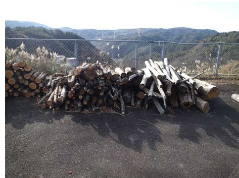
配布予定の伐採木の状況