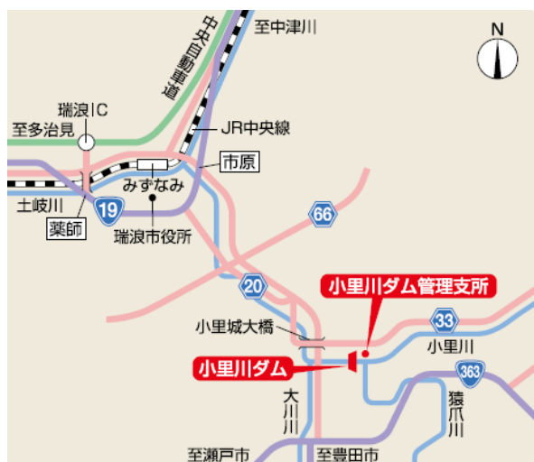
中央自動車道・瑞浪ICから車で約20分。