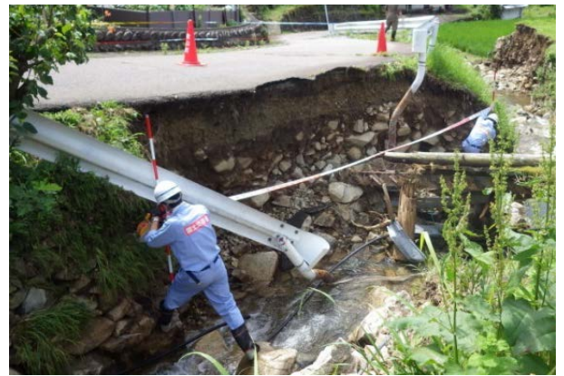
河川の被災状況調査（岐阜県下呂市）