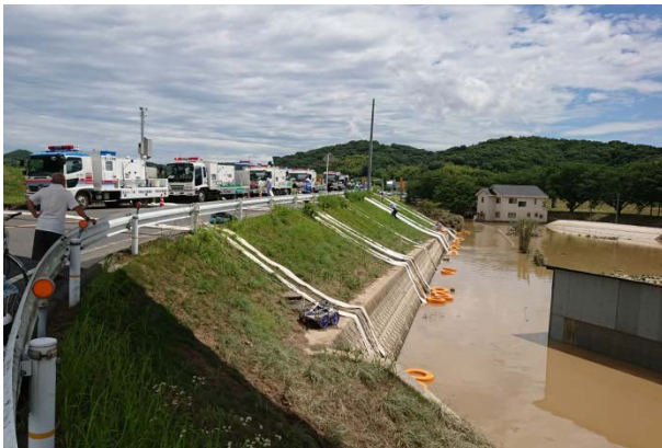
排水作業の様子（岡山県倉敷市）