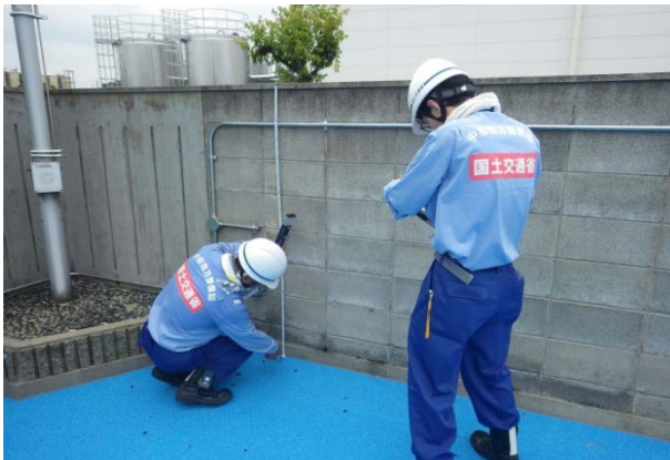
ブロック塀の応急危険度判定調査（大阪府茨木市）