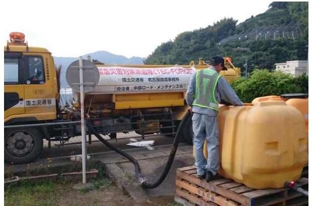
生活用水の給水作業の様子（愛媛県宇和島市）