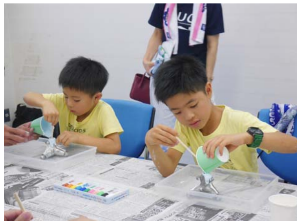
【消波ブロック製作体験】