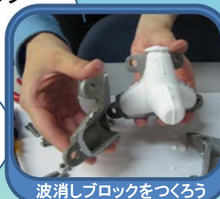
波消しブロックをつくろう