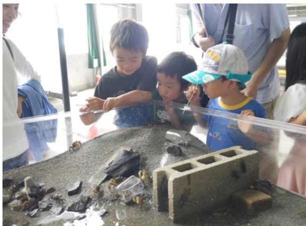
【干潟の生き物プール】