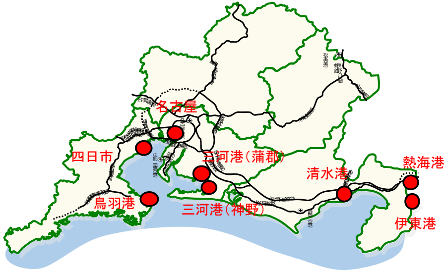
中部地整管内にクルーズ船が寄港あった港の位置図