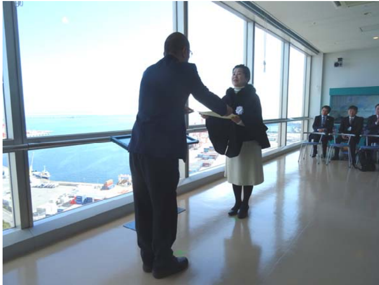
【 応募者への表彰 】