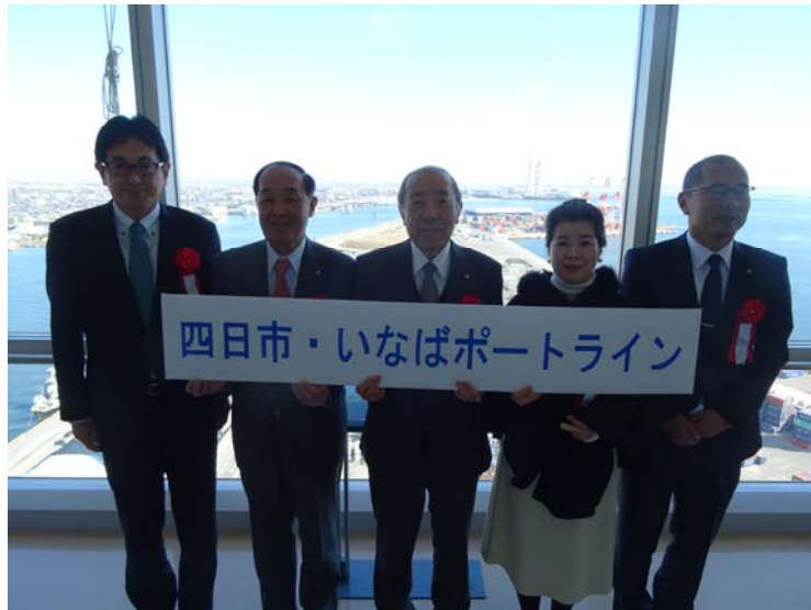
【 記念撮影（四日市港ポートビルうみてらす 14）】