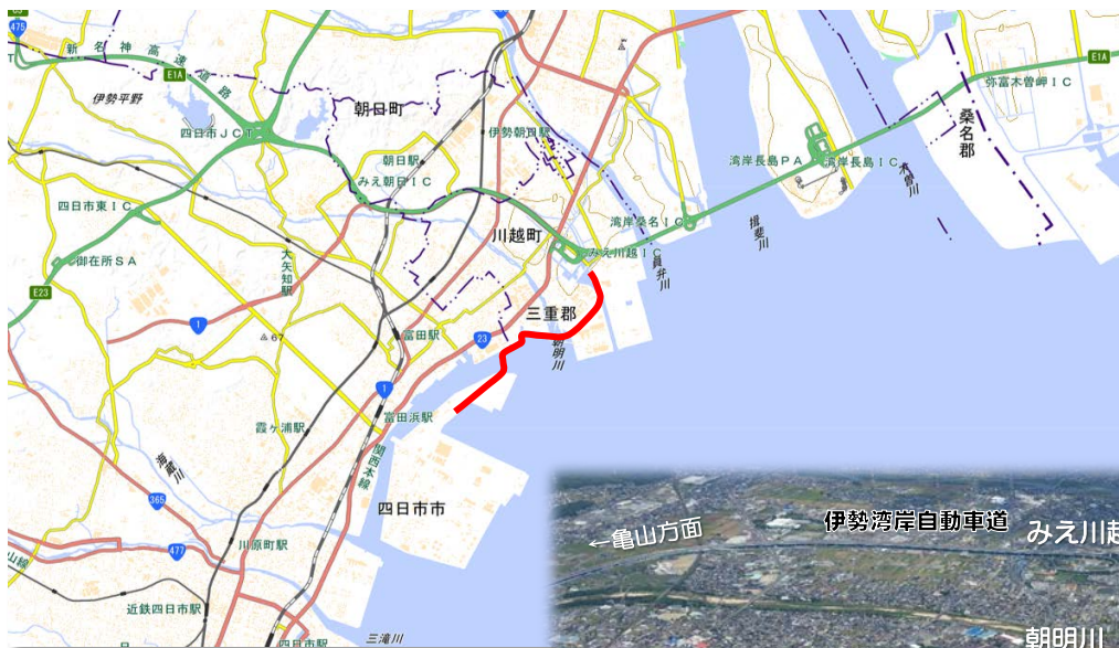
国土地理院地図（電子国土 Web） ( http://mapps.gsi.go.jp ) をもとに 国土交通省中部地方整備局作成