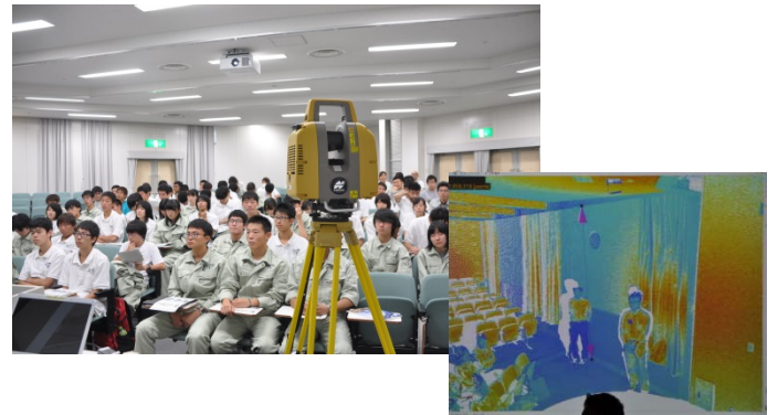
レーザスキャナのデモンストレーションイメージ

※写真左：三重県立相可高等学校、写真右：岐阜工業高等専門学校でのICT講座の状況