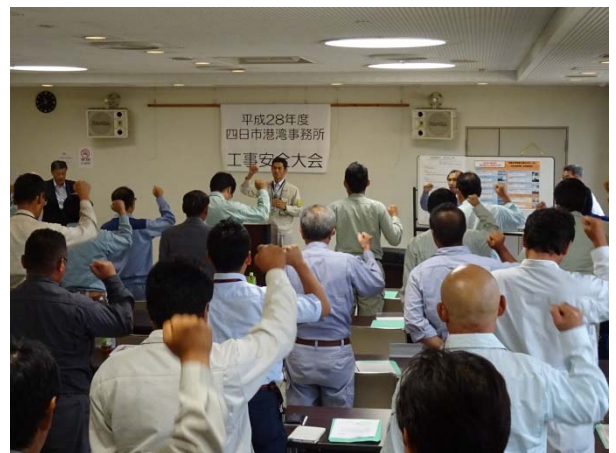
参加者代表による大会(安全)宣言