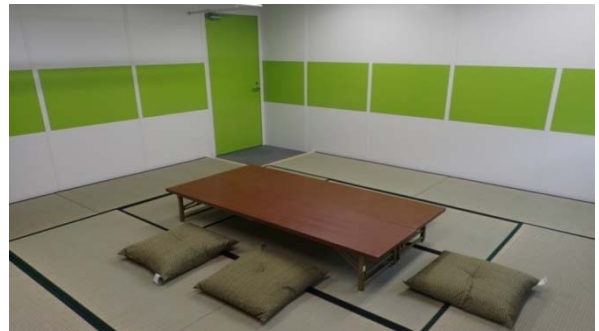
座談会の様子(H28年度)