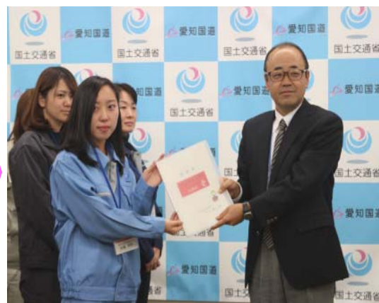
現場環境改善に向けた提案書の提出