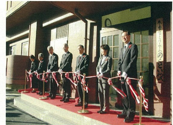
△冬季高齢者住宅「のくとい館」の開所式