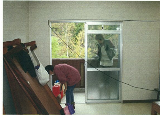
△冬季高齢者住宅開設準備

高齢化率43%の高根地域において、高齢者冬季の生活は、雪に閉ざされ衣食住にも不便をきたす生活である。そのような課題に対し、市の遊休施設を利用した冬季高齢者住宅の開設を核とした事業を展開し、高齢者の生活の質的向上を目指すとともに、ボランティア(若者)との交流、特産品開発を通じた地域コミュニティの再生を目指す。