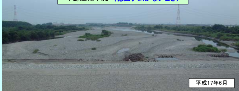
平野庄橋下流（徳山ダムがないとき）

徳山ダムからの補給によりダム下流の平野床橋付近では、断続的に繰り返されていた瀬切れが解消されています。