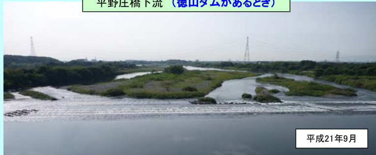
平野庄橋付近の状況