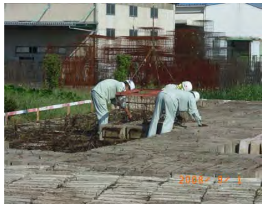
連節ブロック仮置状況