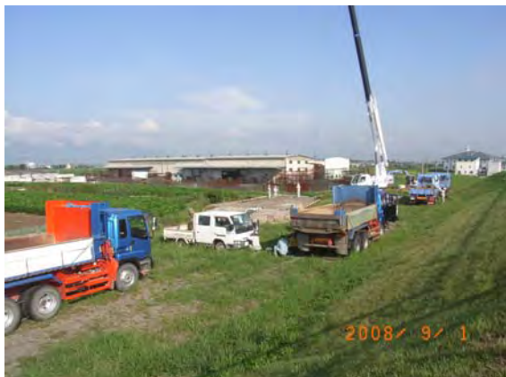
幸田町ストックヤード

8月31日～9月1日、木曾川下流河川事務所保管資材の連節ブロック約8,000個を被災地へ運搬