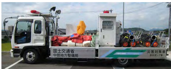
派遣した排水ポンプ車

木曽川下流河川事務所からは9月1日～2日にかけて、排水能力40m 3 /分の排水ポンプ車1台を派遣し内水排除を行いました。