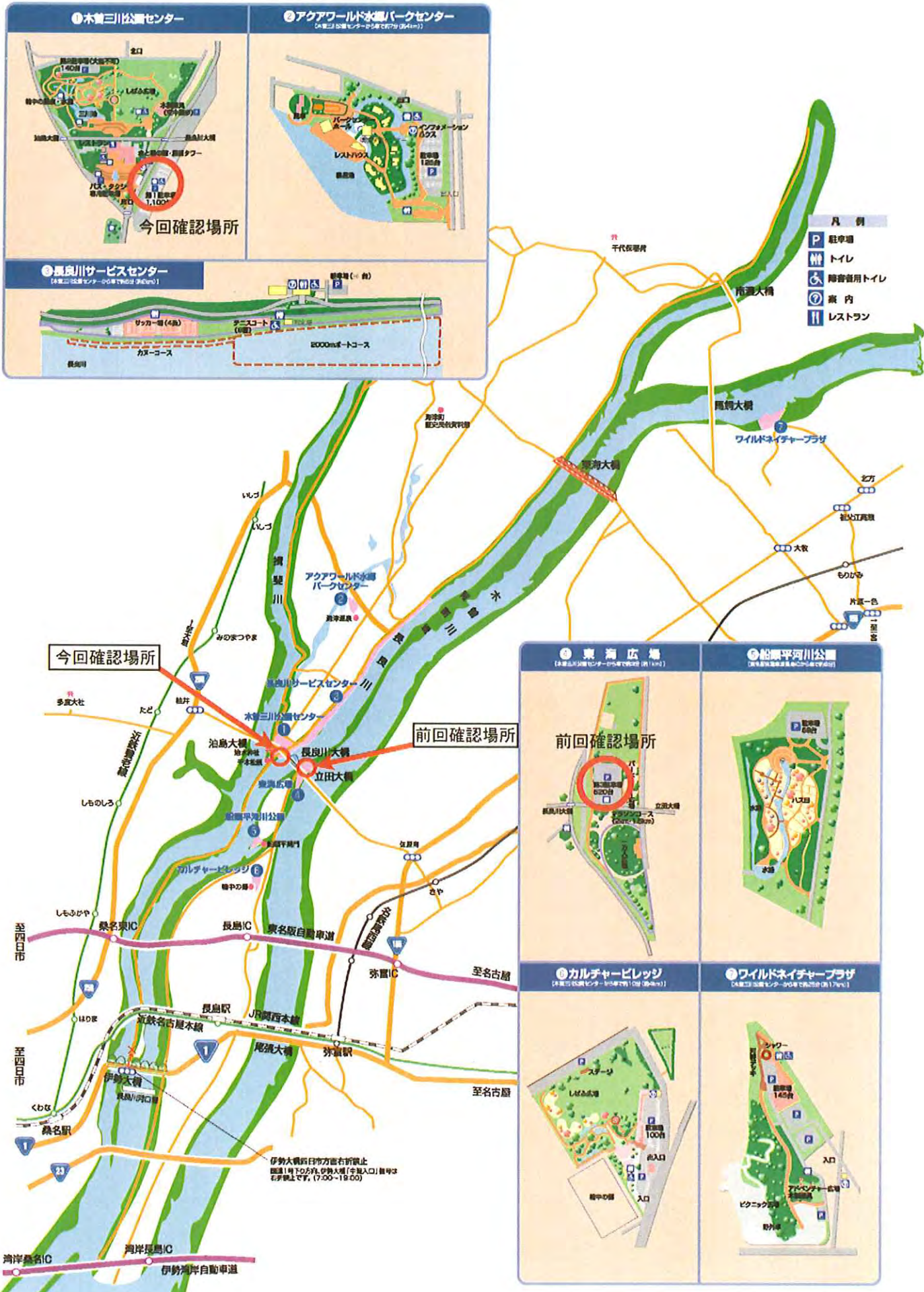
① 木曾三川公園センター