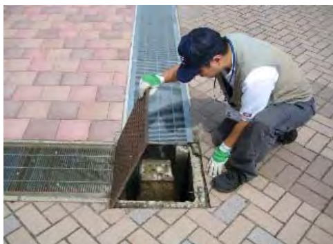
木曽三川公園センター内点検調査