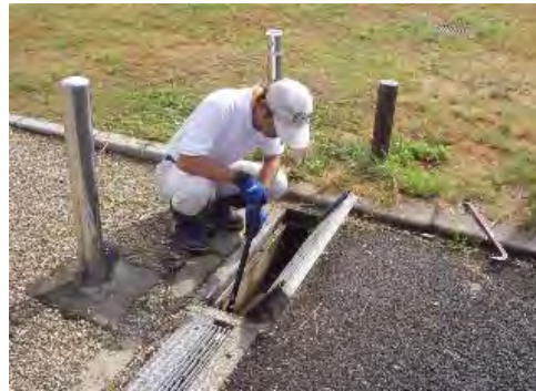
東海広場の駐車場の点検調査