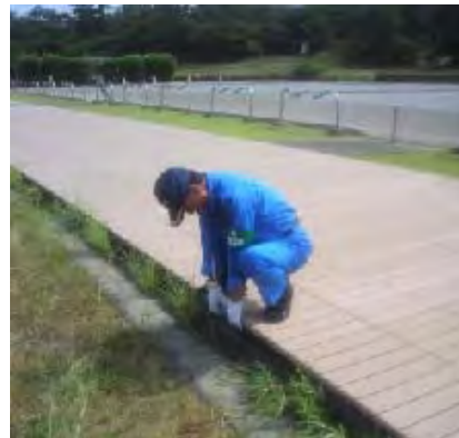
ワイルドネイチャープラザ点検調査