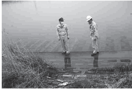
護岸の状態の点検