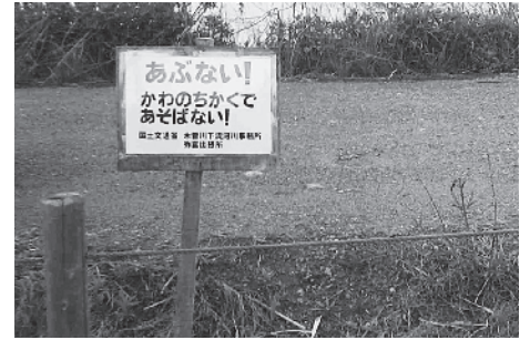
危ないと思われる場所には看板を設置