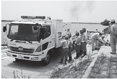
排水ポンプ車の操作訓練