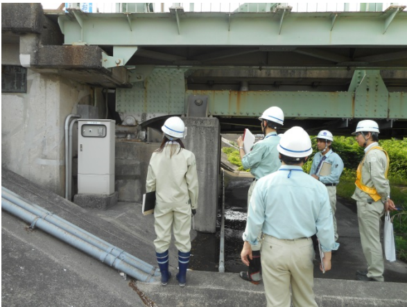
(左上) 排水機場の点検