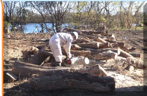
配布樹木イメージ