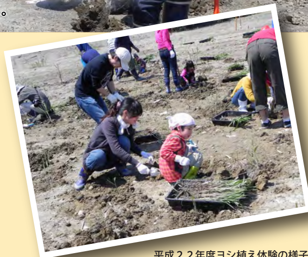
平成22年度ヨシ植え体験の様子