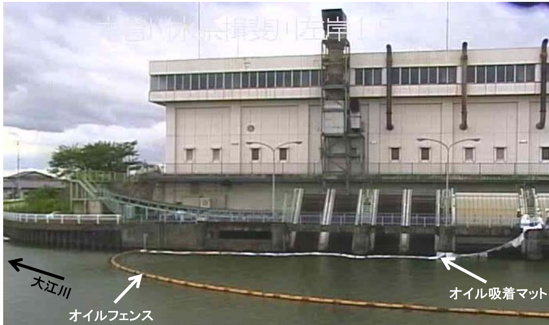
高須輪中排水機場 除塵機前 オイル吸着マット設置状況