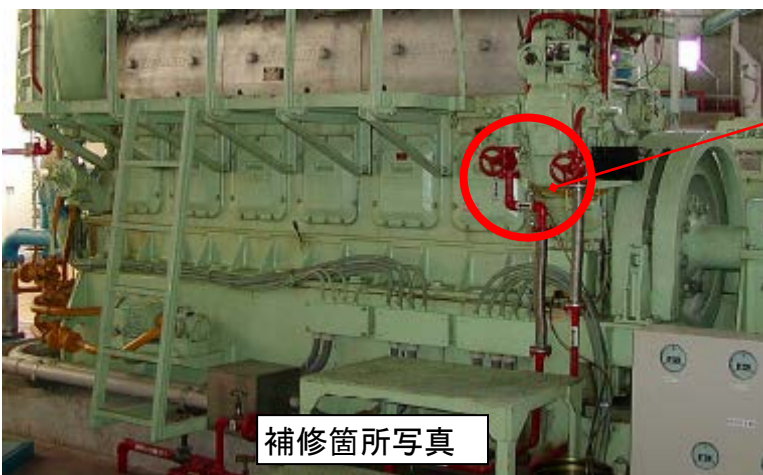
補修箇所 (3号主原動機)