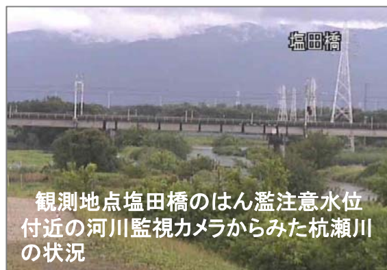
観測地点塩田橋のはん濫注意水位付近の河川監視カメラからみた杭瀬川の状況

7月1日、梅雨前線の影響で、揖斐川の支川杭瀬川の塩田橋地点でははん濫注意水位をこえる出水がありました。今年度、早くも2回目のはん濫注意水位超えの出水でした。