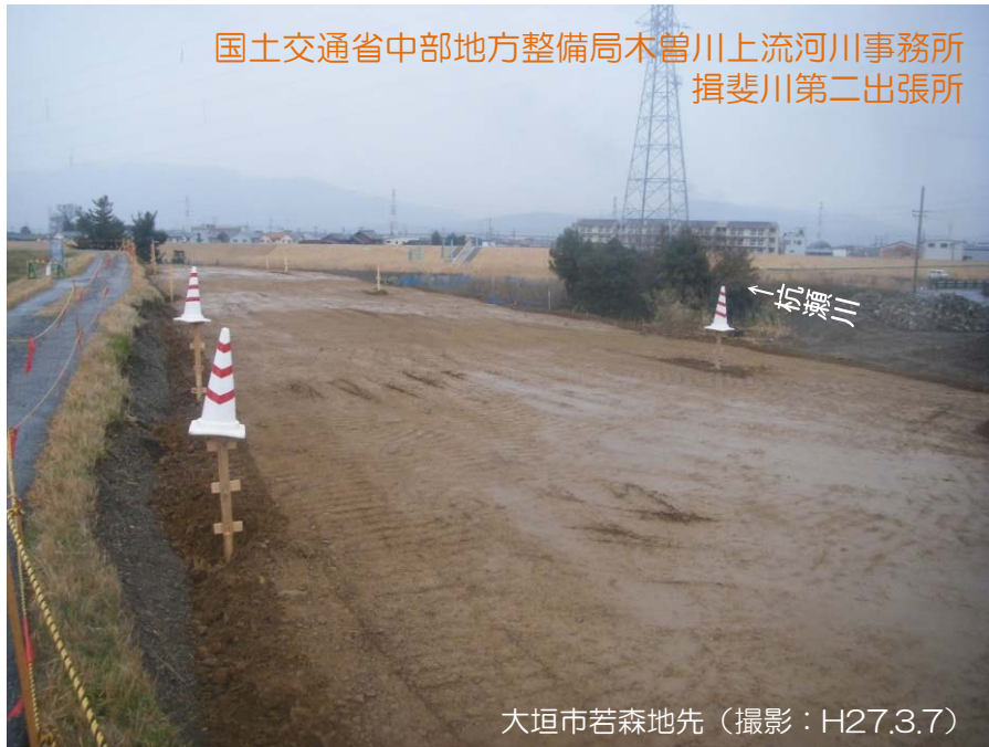
大垣市若森地先（撮影：H27.3.7）

東海地方のこの冬は、12月に寒気の影響を受ける時期が多く寒冬。1月は南から暖かい空気の影響で高温となったが、気温の変動が大きく、3ヶ月間の平均気温平年差は-0.2℃と寒い冬であった。また、12月、1月は低気圧や前線の影響を受けやすく多雨となった。2月はまとまった雨が降らず小雨であったが、3ヶ月間の降水量平年比は140%と雨の多い冬であった。【出典：名古屋地方気象台 報道資料より抜粋】