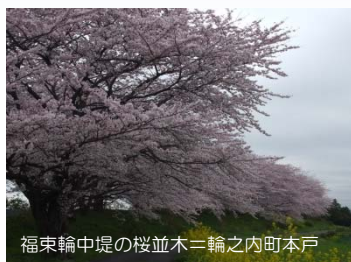
福束輪中堤の桜並木 = 輪之内町本戸

4月初旬、輪之内町本戸地区にて福束輪中堤の桜並木が満開を迎えました。揖斐川堤や河川敷でも多く群生する菜の花との共演が本格的な春の訪れを告げています。