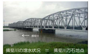
揖斐川の増水状況 = 揖斐川万石地点