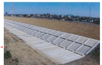
H27.3月完成（安八町牧地先）