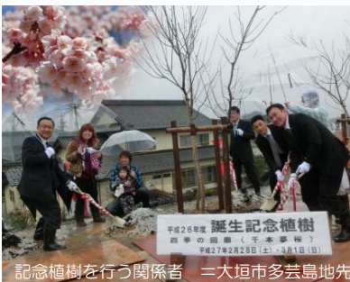
記念植樹を行う関係者 = 大垣市多芸島地先