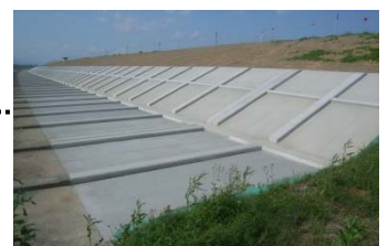
H26.6月完成（輪之内町塩塩地先）