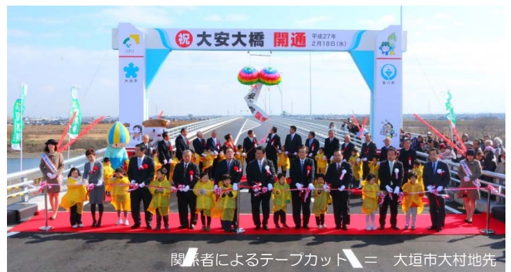
関係者によるテープカット = 大垣市大村地先