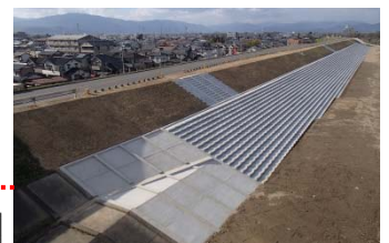
H27.3月完成（大垣市東町地先）