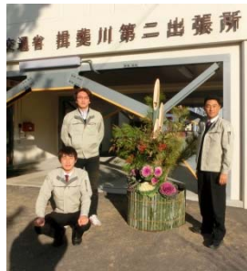
揖斐川第二出張所の職員一同

新年あけましておめでとうございます。 昨年7月の長野県南木曾町、8月の広島県広島市において大規模な土石流が発生。また、9月には御嶽山噴火など、とりわけ土砂災害による被害が顕著な年でした。一方、昨年の大垣における7月から8月の2ヵ月間の総降水量は平年の約2.6倍。中でも、8月9日から10日にかけて、岐阜県山間部を中心に非常に激しい降雨をもたらした台風11号では、揖斐川(万石地点)で戦後12番目の高水位を記録しました。この時、上流の徳山ダム・横山ダムが防災操作に当たり、下流域の水位低下に大きな効果を発揮しました。