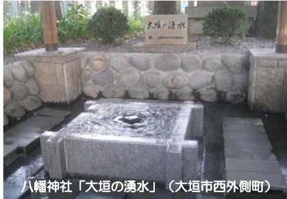
八幡神社「大垣の湧水」（大垣市西外側町）

大垣市内において、「水」に関わるフォーラムや全国大会が開催され、関係者による熱い議論が交わされ、参加者らは熱心に耳を傾けていました。