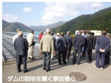
ダムの説明を聞く参加者ら

安八町牧地区の区長ら18名は10月30日（木）、揖斐川上流の徳山ダム・横山ダムを訪れ、ダム内部の見学やダムの役割などを学び理解を深めました。