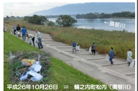
平成26年10月26日 = 輪之内町松内(揖斐川)

10月に「川と海のクリーン大作戦」が行われ、当出張所管内の大垣市、安八町、輪之内町で約2千人が参加。2トントラックに換算して、約3台分のゴミを集めていただきました。 地元のボランティアの方によって、こうした活動が行われていますが、本来、自分で出したごみは自分で適切な手段で処分をする。それが、美しい自然環境を後世に引き継ぐために、現在を生きる私たちの使命であると考えています。