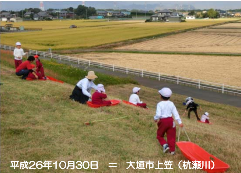
平成26年10月30日 = 大垣市上笠(杭瀬川)

杭瀬川堤防において、近隣の園児や児童たちが堤防の斜面を利用した「堤防すべり」で遊びました。 10月30日(木)、大垣特別支援学校(大垣市西大外羽)の児童たちは、ソリを自分たちで運びながら堤防を駆け上がり、「楽しいな!」「一緒に滑ろうよ!」などと声を掛け合い、ソリに乗って勢いよく滑り降りていました。静かな田園地帯に、子どもたちの元気な笑い声が響き渡り微笑ましい情景でした。