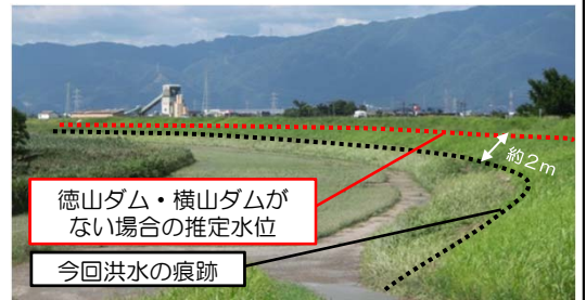
ダムによる水位低下効果(大垣市川並地先)