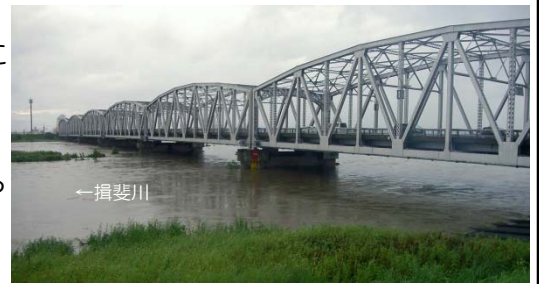
台風11号による揖斐川の増水状況(万石地点)

新年あけましておめでとうございます。 昨年7月の長野県南木曾町、8月の広島県広島市において大規模な土石流が発生。また、9月には御嶽山噴火など、とりわけ土砂災害による被害が顕著な年でした。一方、昨年の大垣における7月から8月の2ヵ月間の総降水量は平年の約2.6倍。中でも、8月9日から10日にかけて、岐阜県山間部を中心に非常に激しい降雨をもたらした台風11号では、揖斐川(万石地点)で戦後12番目の高水位を記録しました。この時、上流の徳山ダム・横山ダムが防災操作に当たり、下流域の水位低下に大きな効果を発揮しました。