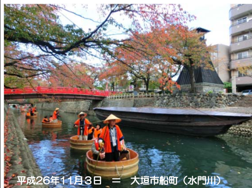
平成26年11月3日 = 大垣市船町(水門川)

秋の季節を楽しみながら、大垣市中心部を流れる水門川を下る「水の都おおがきたらい舟」が、10月4日から11月16日までの土・日・祝日の12日間開催され、春と秋の両イベントを合わせ、総勢4千人弱の方々に乗船されました。