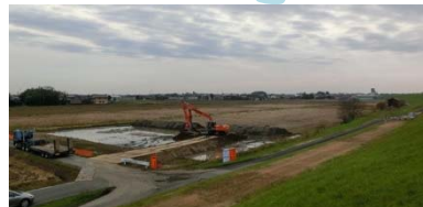
⑥輪之内町大吉新田地先