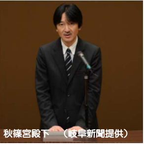
秋篠宮殿下