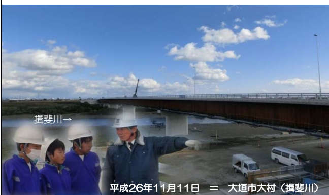
平成26年11月11日 = 大垣市大村(揖斐川)

大垣市立江並中学校(大垣市外濑)の2年生3人が、揖斐川で建設中の新橋(名称:大安大橋)を訪れ、11月11日、12日の2日間の日程で職場体験学習に臨みました。