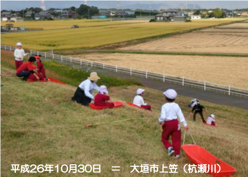
平成26年10月30日 = 大垣市上笠(杭瀬川)

杭瀬川堤防において、近隣の園児や児童たちが堤防の斜面を利用した「堤防すべり」で遊びました。 10月30日(木)、大垣特別支援学校(大垣市西大外羽)の児童たちは、ソリを自分たちで運びながら堤防を駆け上がり、「楽しいな!」「一緒に滑ろうよ!」などと声を掛け合い、ソリに乗って勢いよく滑り降りていました。静かな田園地帯に、子どもたちの元気な笑い声が響き渡り微笑ましい情景でした。