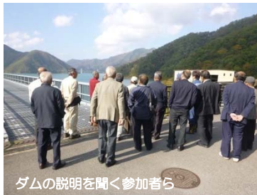
ダムの説明を聞く参加者ら

安八町牧地区の区長ら18名は10月30日（木）、揖斐川上流の徳山ダム・横山ダムを訪れ、ダム内部の見学やダムの役割などを学び理解を深めました。