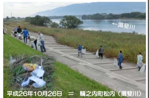
平成26年10月26日 = 輪之内町松内(揖斐川)

10月に「川と海のクリーン大作戦」が行われ、当出張所管内の大垣市、安八町、輪之内町で約2千人が参加。2トントラックに換算して、約3台分のゴミを集めていただきました。 地元のボランティアの方によって、こうした活動が行われていますが、本来、自分で出したごみは自分で適切な手段で処分をする。それが、美しい自然環境を後世に引き継ぐために、現在を生きる私たちの使命であると考えています。