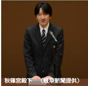
秋篠宮殿下