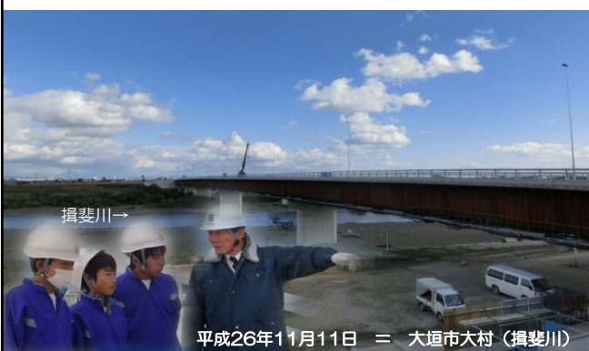
平成26年11月11日 = 大垣市大村(揖斐川)

大垣市立江並中学校(大垣市外濑)の2年生3人が、揖斐川で建設中の新橋(名称:大安大橋)を訪れ、11月11日、12日の2日間の日程で職場体験学習に臨みました。