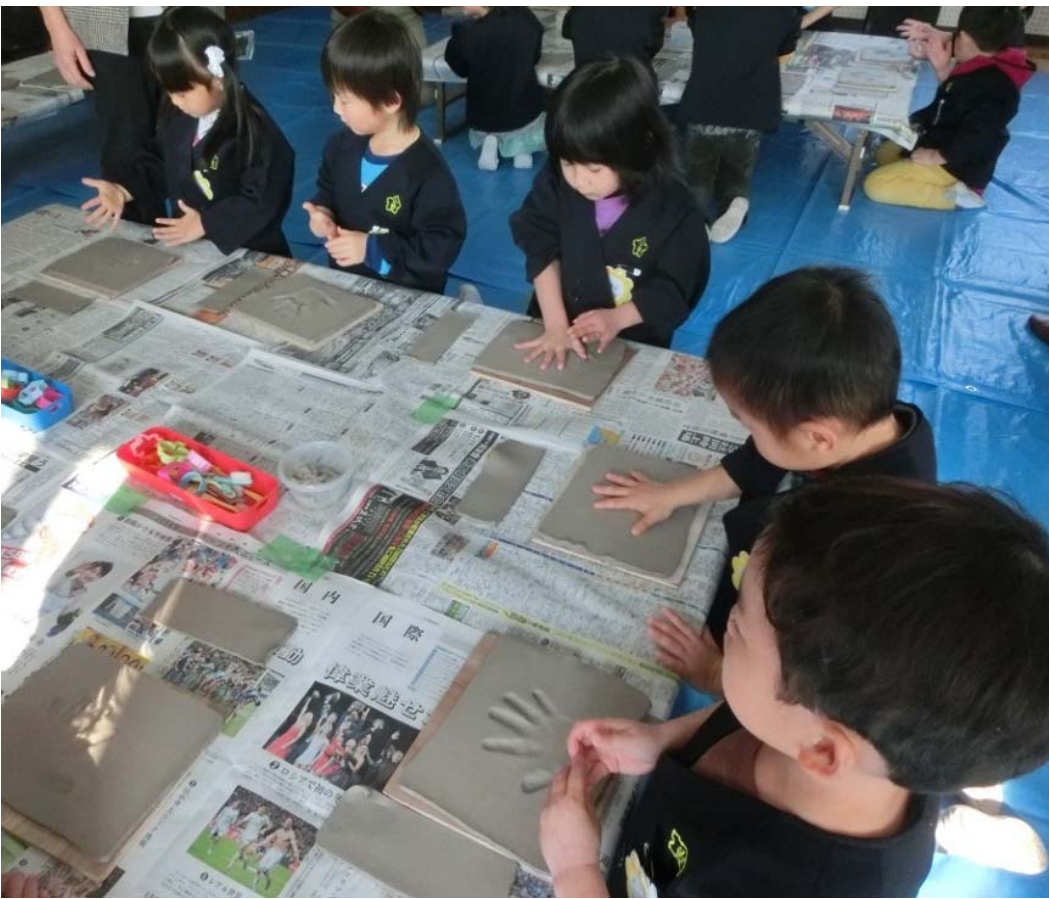
手形プレート作りを楽しむ園児たち＝ 小野幼稚園