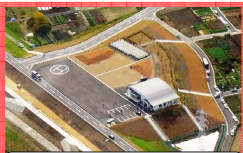
揖斐川大垣河川防災ステーション (大垣市) 平成21年度完成