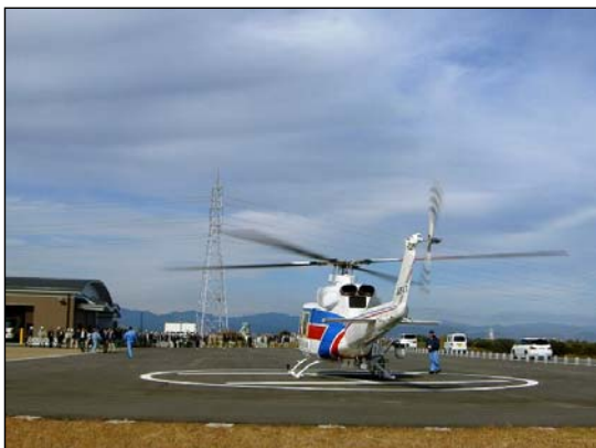
防災ヘリコプター（中部地方整備局所管）