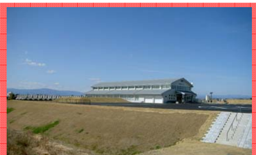
木曽川羽島河川防災ステーション (羽島市) 平成22年度完成