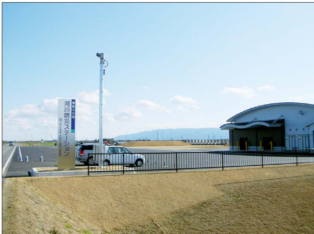
揖斐川大垣河川防災ステーションを揖斐川右岸上流より望む

「河川防災ステーション」は、水防活動を行う上で必要な土砂などの緊急用資材を事前に備蓄しておくほか、資材の搬出入や防災ヘリコプターの離着陸などに必要な作業面積を確保するものです。洪水時には市町村が行う水防活動を支援し、災害が発生した場合には緊急復旧などを迅速に行う基地となるとともに、平常時には地域のみなさまの防災学習の場として、また河川を中心とした文化活動の拠点として大いに活用される施設です。