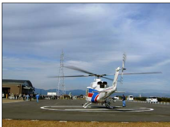
防災ヘリコプター（中部地方整備局所管）