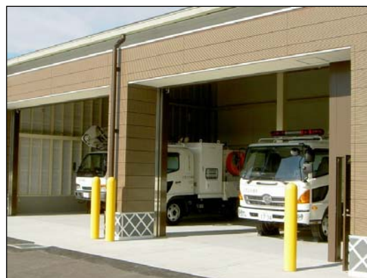
排水ポンプ車（2台配置）、照明車（1台配置）