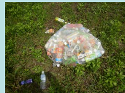
H23.5.2 ペットボトル多数