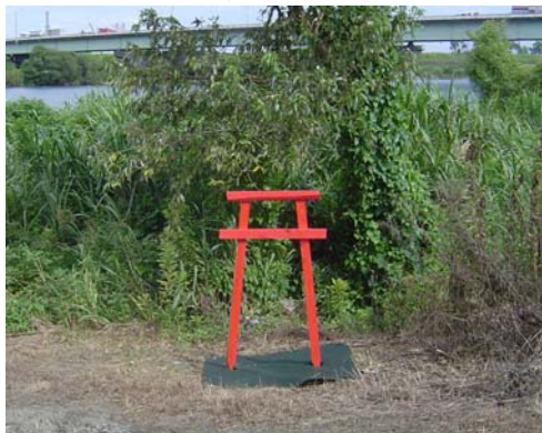
ごみよけトリー(幅70cm、高さ1.2m)