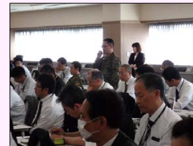
意見交換（陸上自衛隊）