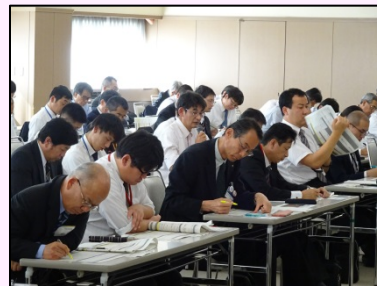
取組紹介（輪之内町）